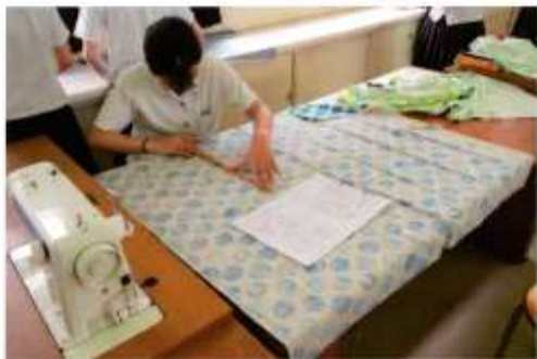
本曜日の5限目、6限目に行われる選択科目群Yの「服飾手芸」にお邪魔しました。エコバック制作の様子です。生地を直線に引くことに苦労している生徒。個案にはさみで切っている生徒など、黙々と作業に取り組んでいる姿は真剣でした。すばらしいエコバックの完成を期待しています。

普通【選択進学】クラスは3年次 のクラス編成である。2年次に普通 【文系】クラスに在籍する生徒が選 択できる。「美容師」、「保育士」、「公 務員」などなど、自分が就きたい職 業を明確に決めている生徒が多く在 籍するクラス。進路先は短期大学、 専門学校、就職、公務員など幅広く 選ぶことができるクラスである。