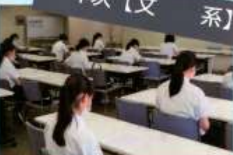
「手作り楽器を作ろう!」授業あるあるクイズなど、幼児 教育学科やフードデザイン学科の先生方の授業を受ける ことができる。短大の学習環境を体験できるのも魅力の 一つ。この日は卒業生の魅力について学習しました。